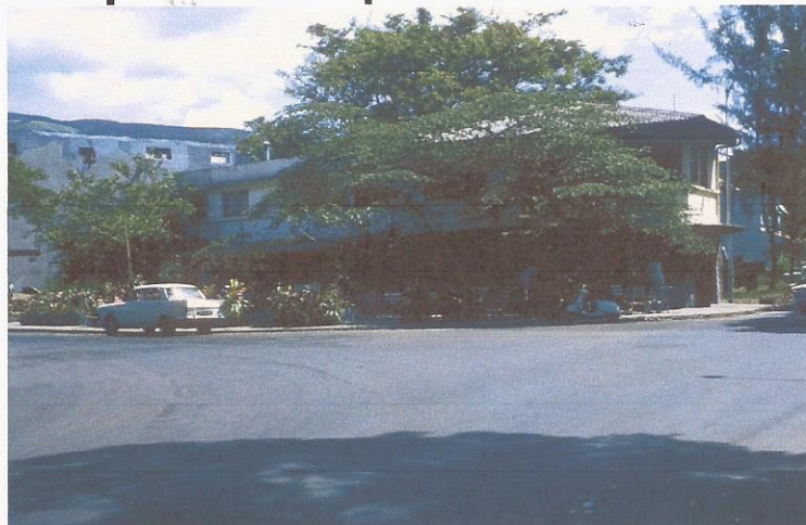
Le Vahiria :