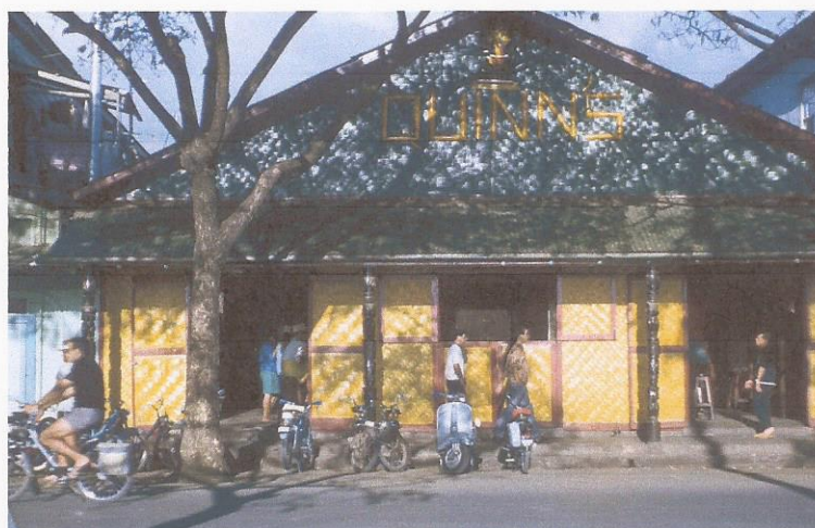
Le Quinn's :