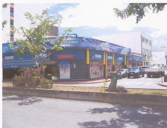
Le Zizou bar :