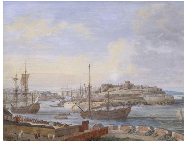
Brest : batteries du port de Brest au XVIIIe siècle (par Louis Nicolas van Blarenberghe, 1716-1794, musée du Louvre.)