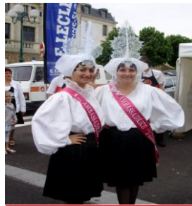
La Reine des Sables, avec sa Dauphine, en tenue de Sablais

Hôtel Ibis - 44, avenue du Général de Gaulle : ♿♿ 3 chambres, recommandé